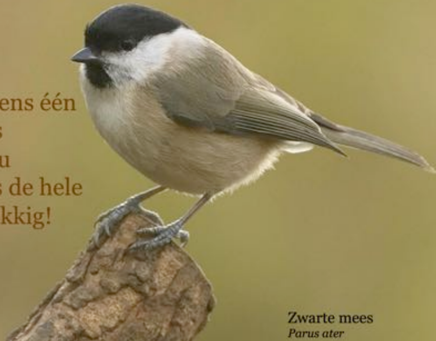
Zwarte mees Parus ater

Als ieder mens één ander mens gelukkig zou maken, was de hele wereld gelukkig!